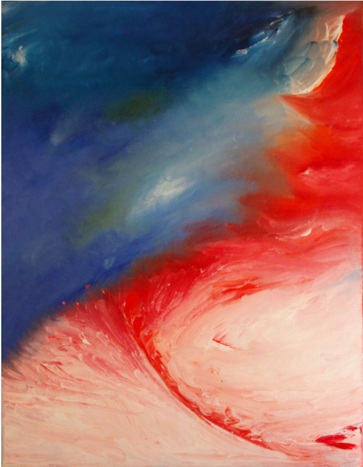
Lien du Sang